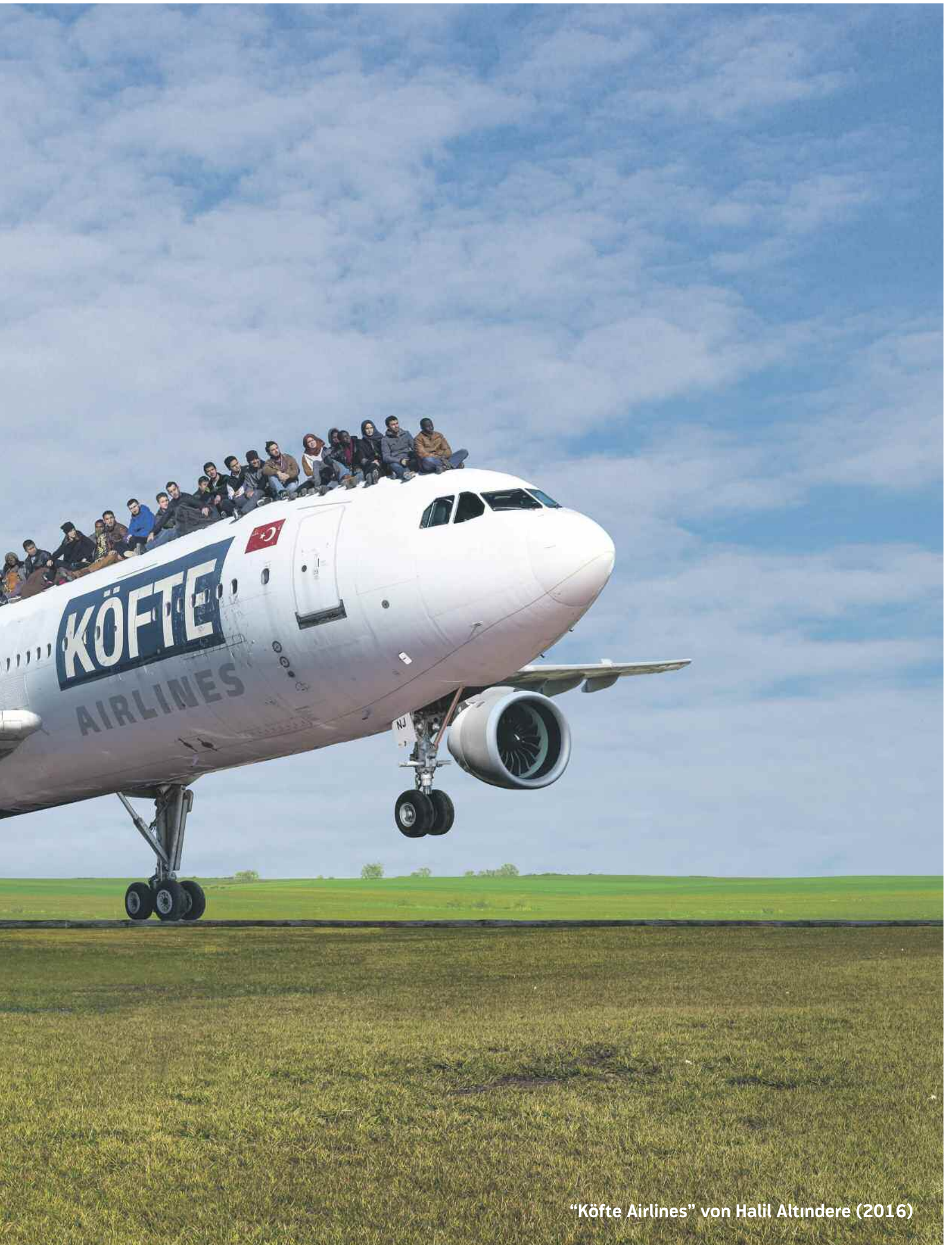
"Köfte Airlines" von Halil Altındere (2016)